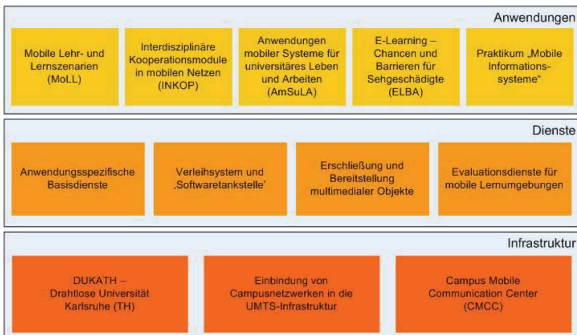
Abbildung 3 - Teilprojekte im Schichtenmodell der Notebook Universität Karlsruhe (TH)