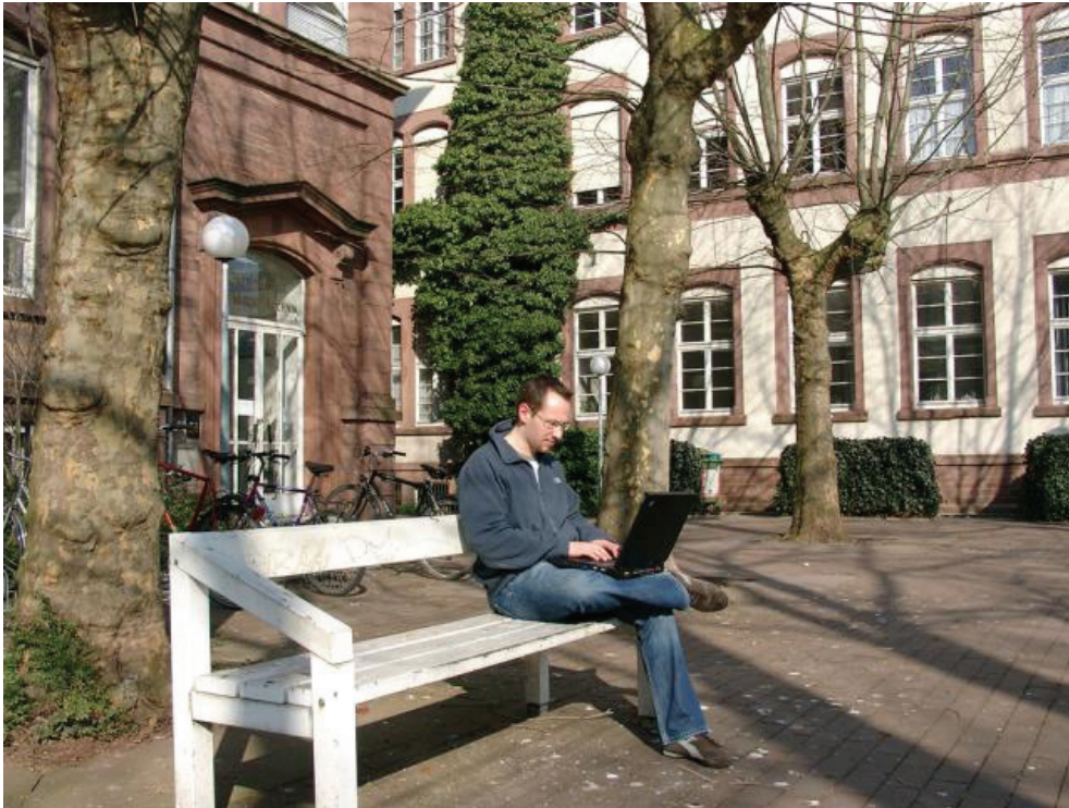
Abbildung 2 - ...an jedem Ort.