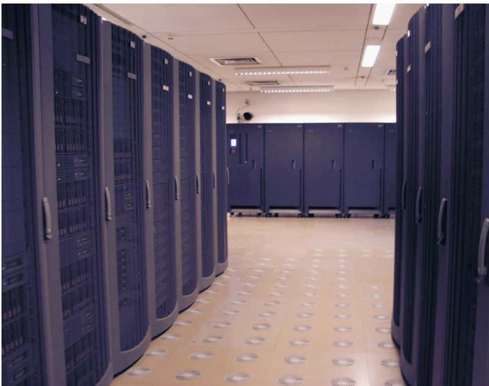
Die erste Ausbaustufe des neuen Landeshöchstleistungsrechners HP XC6000 am Rechenzentrum der Universität Karlsruhe (TH).

Automatisierter Prozessor-Entwurf mit CoWare LISATek