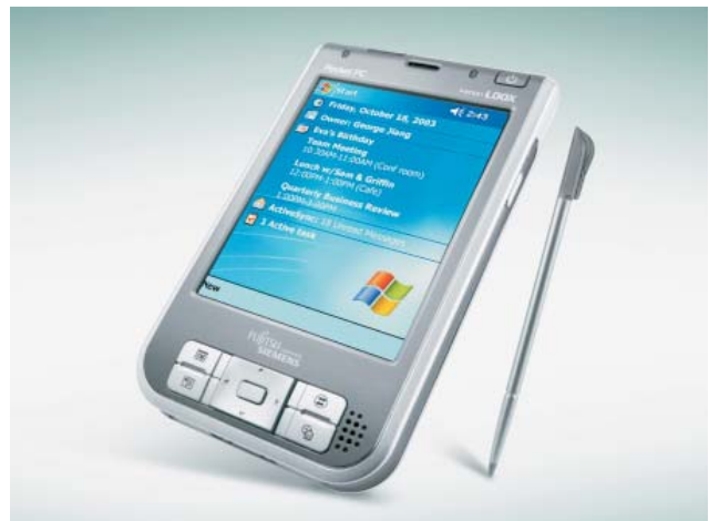
Pocket Loox 720